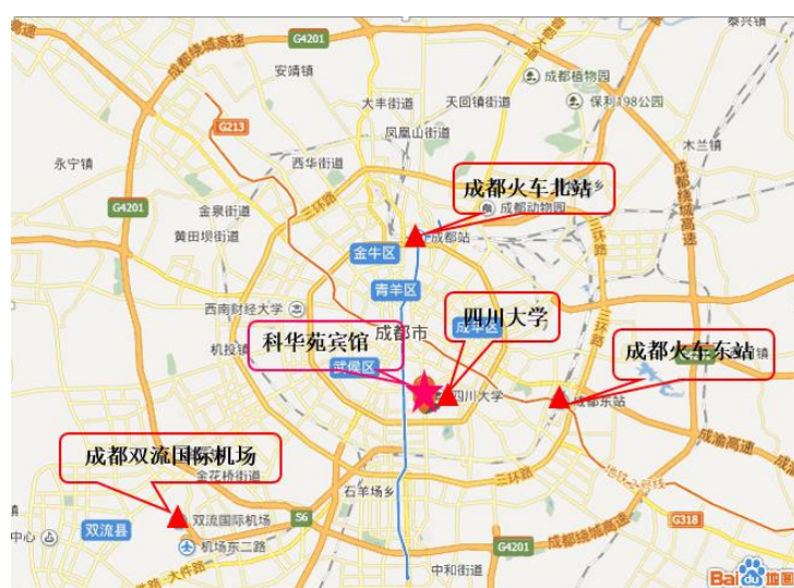
附图2：会场周边500米范围分布图